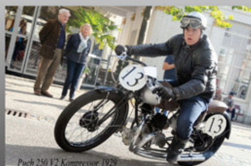
Puch 250 1/2 Kompressor 1929