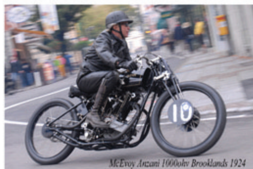
McEvoy Anzani 1000ohv Brooklands 1924