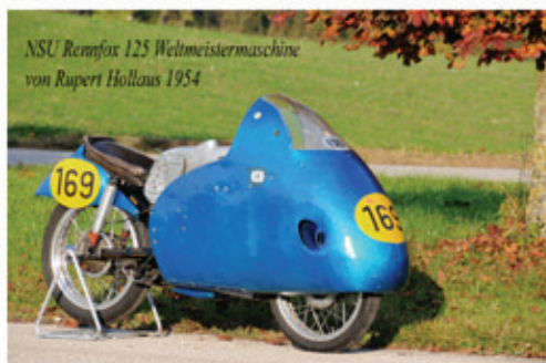
NSU Rennfox 125 Weltmeistersmaschine von Rupert Hollaus 1954