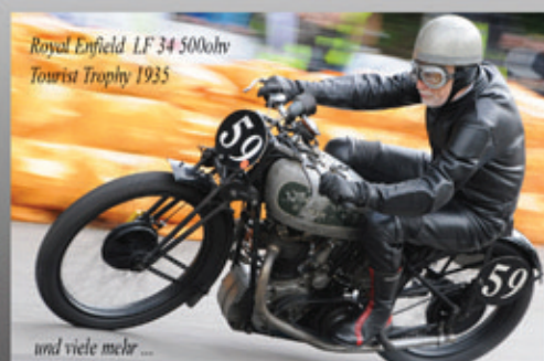
Royal Enfield LF 34 500ohv Tourist Trophy 1935