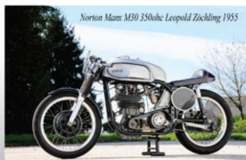
Norton Manx M30 350ohc Leopold Zöchling 1955