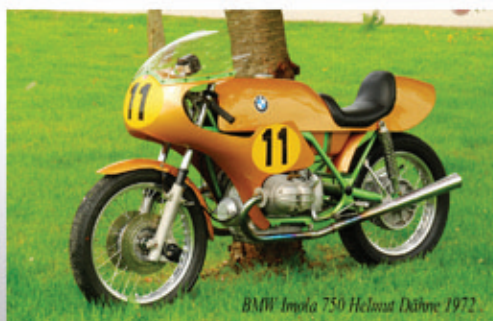
BMW Imota 750 Helmut Dähne 1972