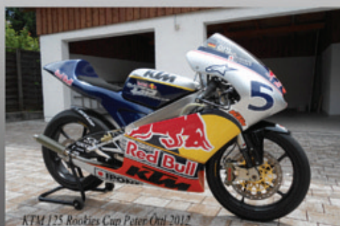
KTM 125 Rookies Cup Peter Ortl 2012